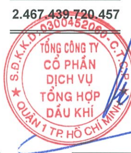
Phùng Tuấn Hà Chủ tịch HĐQT Ngày 19 tháng 3 năm 2018

Các thuyết minh từ trang 9 đến trang 42 là một phần cấu thành báo cáo tài chính riêng này.