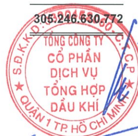
Phùng Tuấn Hà Chủ tịch HĐQT Ngày 19 tháng 3 năm 2018

Các thuyết minh từ trang 9 đến trang 42 là một phần cấu thành báo cáo tài chính riêng này.