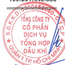
Phùng Tuấn Hà Chủ tịch HĐQT Ngày 19 tháng 3 năm 2018

Các thuyết minh từ trang 9 đến trang 42 là một phần cấu thành báo cáo tài chính riêng này.