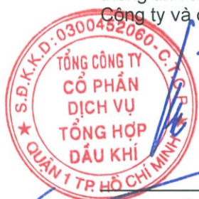
Phùng Tuấn Hà Chủ tịch Hội đồng Quản trị

Người sử dụng báo cáo tài chính riêng của Tổng Công ty nên đọc cùng với báo cáo tài chính hợp nhất của Tổng Công ty và các công ty con cho năm tài chính kết thúc ngày 31 tháng 12 năm 2017 để có đủ thông tin về tình hình tài chính, kết quả hoạt động kinh doanh và tình hình lưu chuyển tiền tệ của Tổng Công ty và các công ty con.